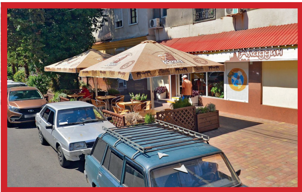
Логотип не соответствуют рекомендованным размерам