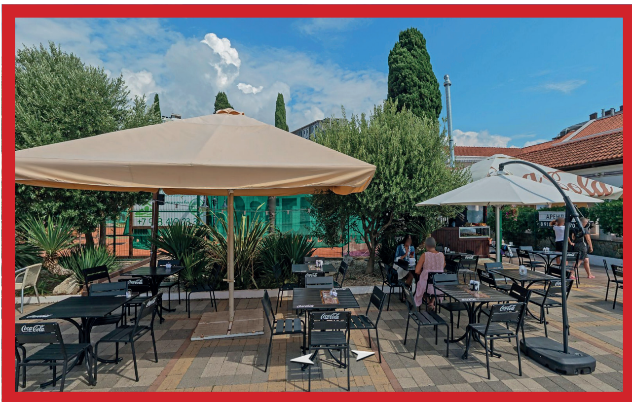
Разные зонты на одной территории