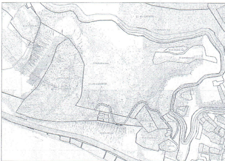
Схема местоположения границ постоянного публичного сервитута, устанавливаемого для прохода и проезда к земельному участку с кадастровым номером 23:49:0125010:61, через обособленную часть с кадастровым номером 23:49:0125010:1016 единого землепользования 23:49:0000000:25 и обособленную часть с кадастровым номером 23:49:0125010:67 единого землепользования 23:49:0000000:141 Лазаревского района города Сочи

Информация по земельным участкам: Адрес земельных участков: Краснодарский край, г.Сочи, р-н Лазаревский Кадастровый номер земельного участка 23:49:0125010:1016, площадь земельного участка по документам 253 018 кв.м. Кадастровый номер земельного участка 23:49:0125010:67, площадь земельного участка по документам 91 162 кв.м.