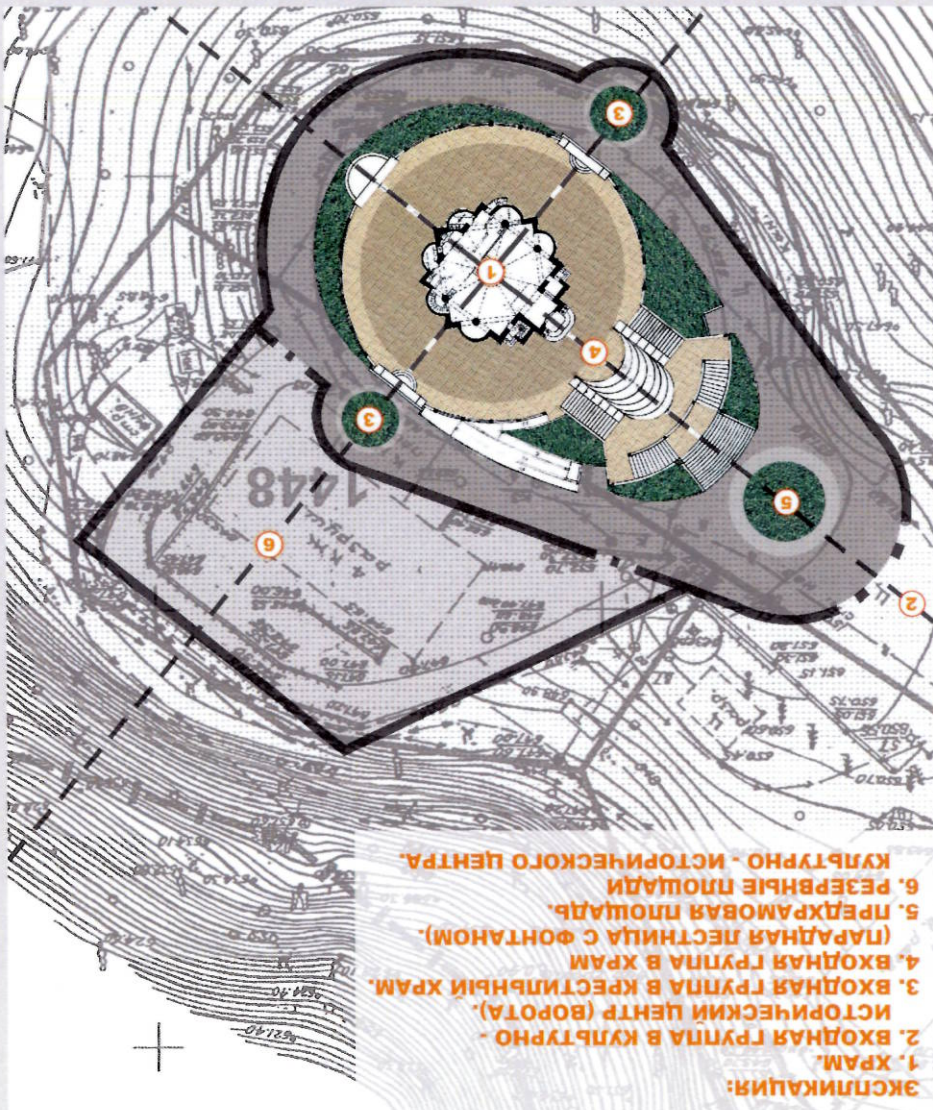
СХЕМА ТЕПЕРАЛЬНОГО ПЛАНА КУЛЬТУРНО - ИСТОРИЧЕСКОГО ЦЕНТРА (СИТУАЦИОННЫЙ ПЛАН)