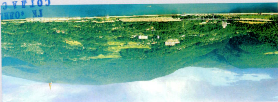
ФОТОГРАФИЯ МЕСТНОСТИ ГОРЫ АХУН Г. СОЧИ С ВРАЩЕНЫМ КУЛЬТУРНО - ИСТОРИЧЕСКОГО ЦЕНТРА.