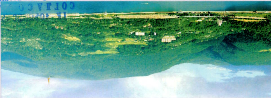
ФОТОФИКСАЦИЯ МЕСТНОСТИ ГОРЫ АХУН Т. СОЧИ С ВПИСОВКОЙ КУЛЬТУРНО - ИСТОРИЧЕСКОГО ЦЕНТРА