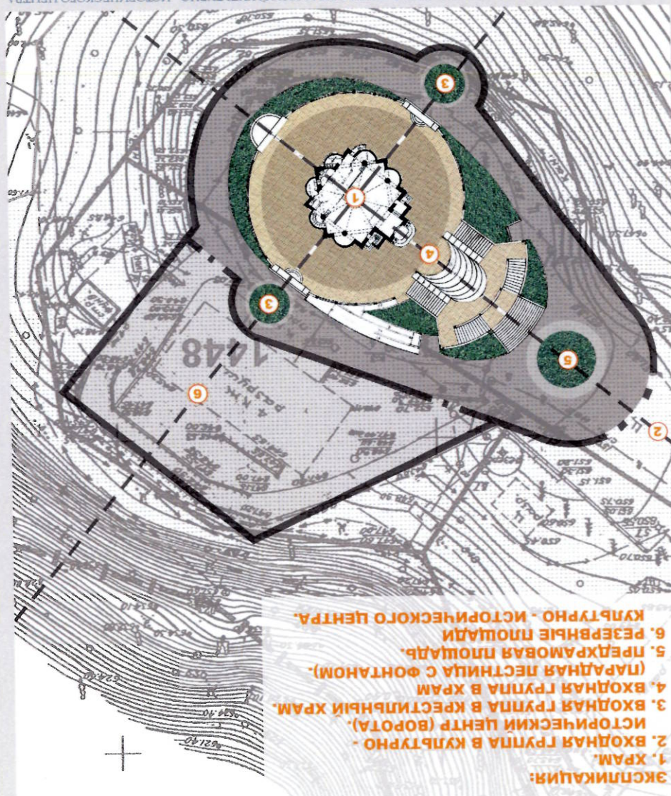
СХЕМА ТЕПЛАЯНОГО ПЛАНА КУЛЬТУРНО - ИСТОРИЧЕСКОГО ЦЕНТРА (СИТУАЦИОННЫЙ ПЛАН)