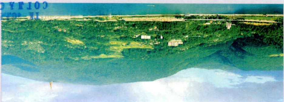
ФОТОГРАФИЯ МЕСТНОСТИ ГОРЫ АХУН Г. СОЧИ С ВРИСОВКОЙ КУЛЬТУРНО - ИСТОРИЧЕСКОГО ЦЕНТРА

Главный архитектор: ДАВЫДОВ Н.В. Главный инженер: ТРЕТЬЯКОВ А.А. 01.01.2011