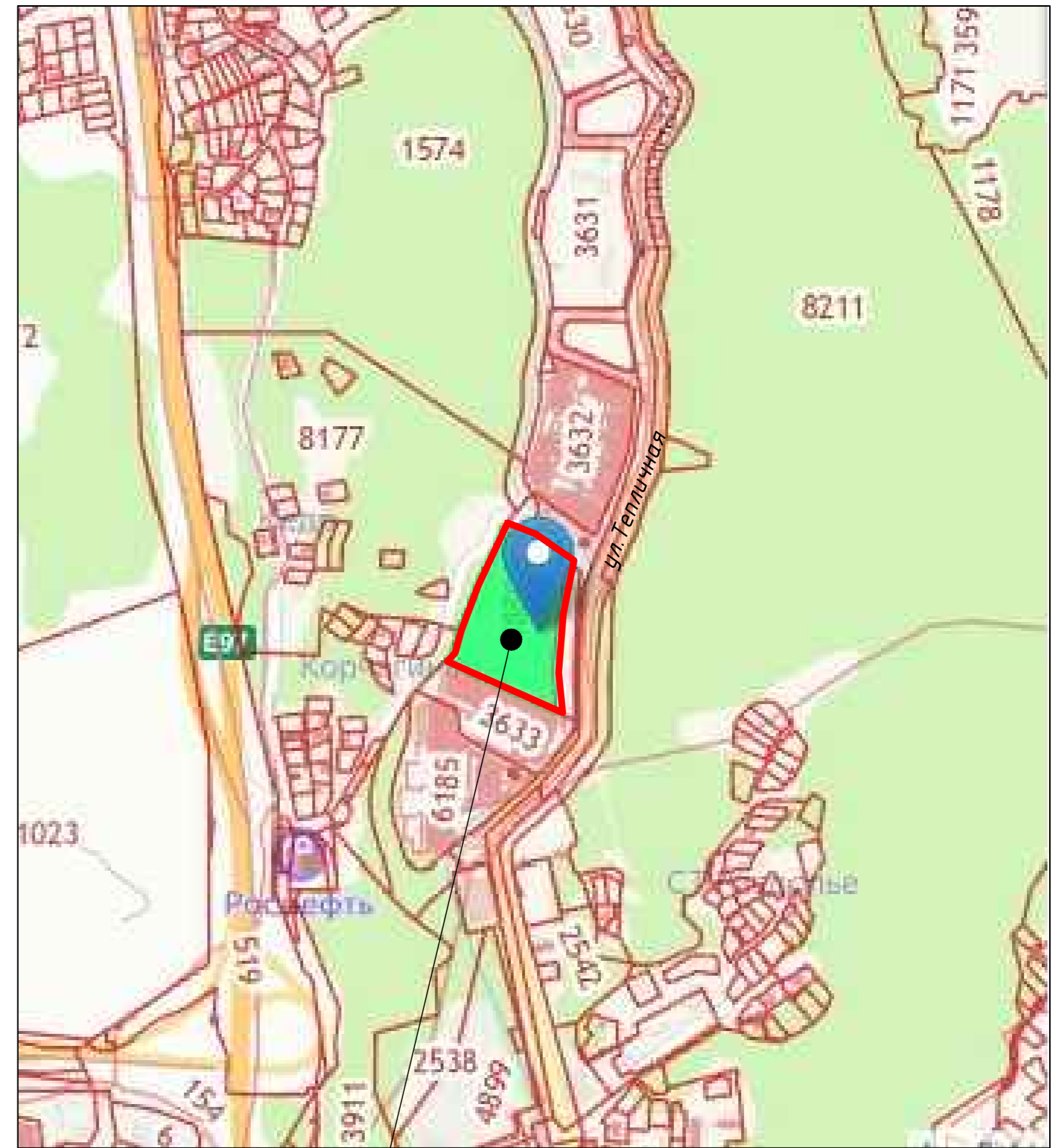
Проектируемый участок с кад. №23:49:0308002:4885