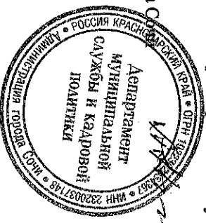
Перечень Муниципального имущества, подлежащего передаче в оперативное управление администрации Центрального внутригородского района города Сочи