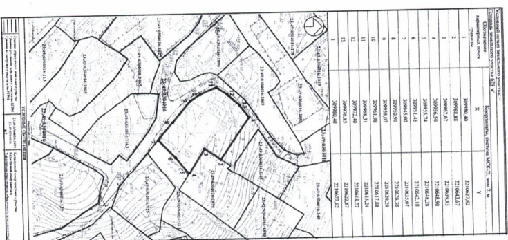
СХЕМА расположения земельного участка или земельных участков на кадастровом плане территории

Директор департамента архитектуры и градостроительства администрации муниципального образования городской округ город-курорт Сочи Краснодарского края